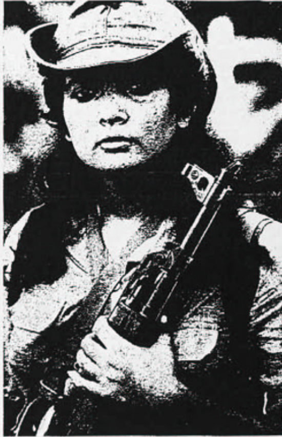
Fotografía del cartel de la exposición «Cambio de sentidos», organizada por el Ayuntamiento de Cinco Casas (Ciudad Real).