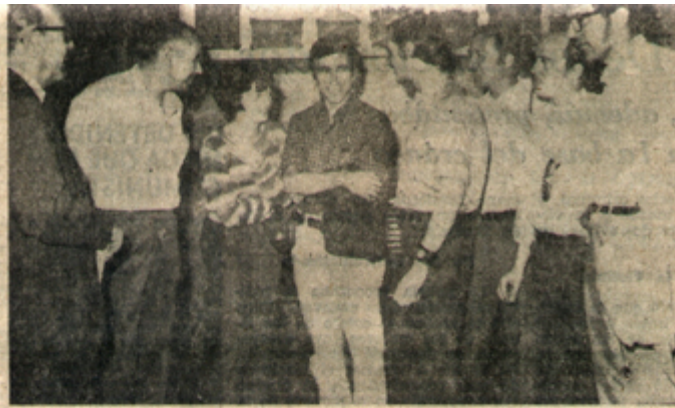
ARTISTAS PLASTICOS ROSARINOS de vanguardia que visitan nuestra provincia para desarrollar un plan cultural.