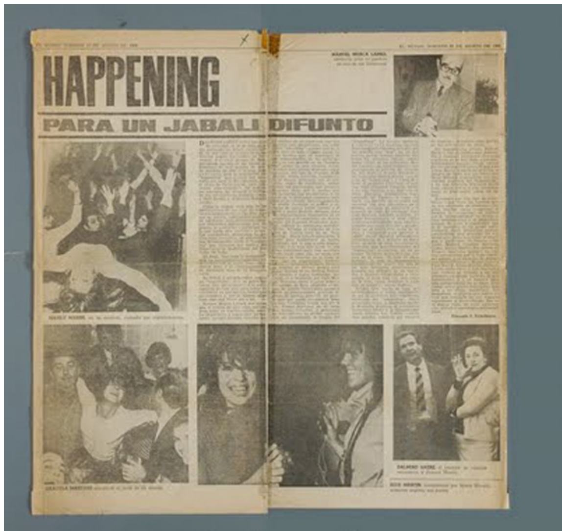
Art of the media, "Happeining para un jabalí difunto" ("Happening for a Dead Wild Boar"), 1966