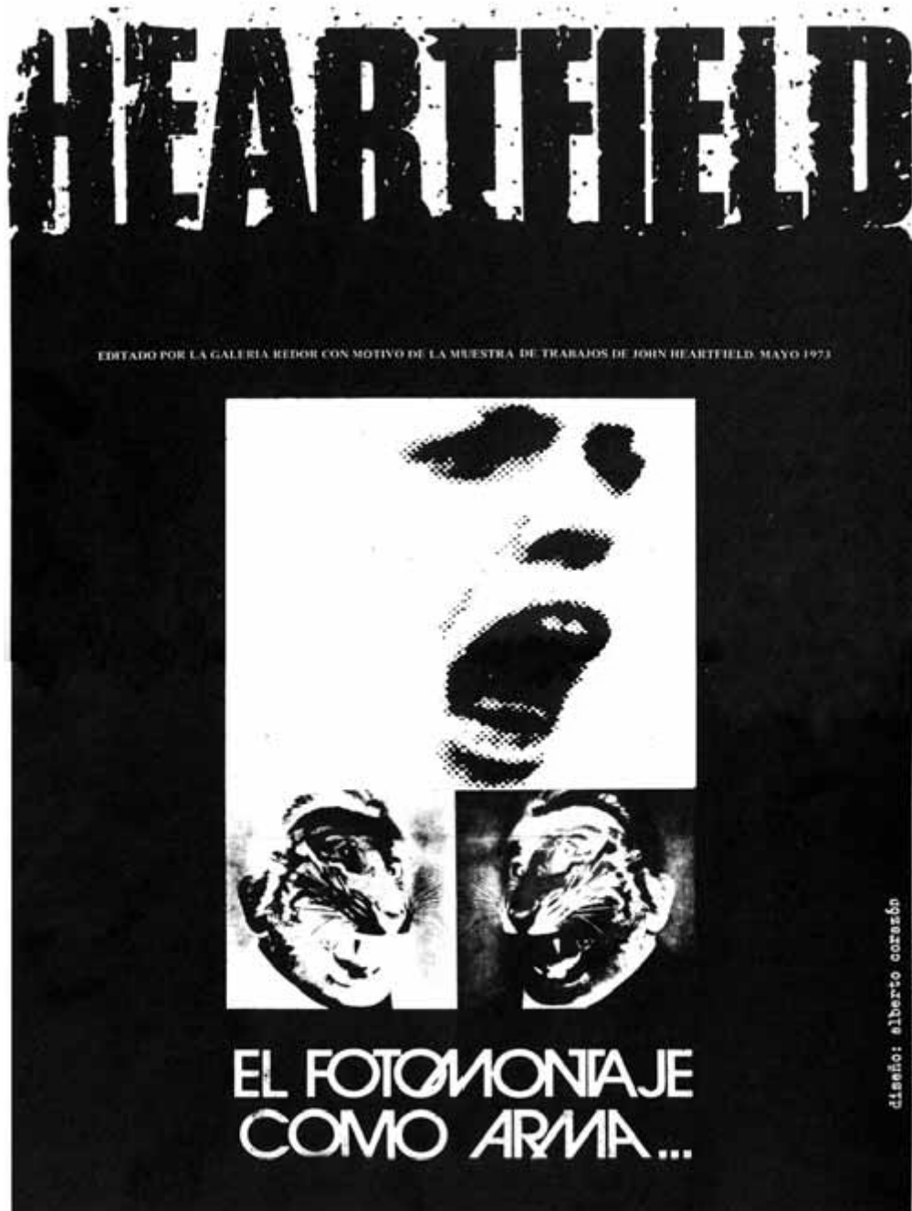
Catálogo de la exposición John Heartfield, Galería Redor, Madrid, 1972.

De dicha yuxtaposición de cortes sincrónicos resulta el relato no progresivo (insistimos: el discurrir sobre un eje temporal no siempre significa progreso, acumulación o perfeccionamiento de las prácticas) de cuatro grandes paradigmas.