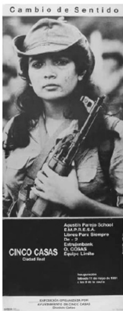
Cartel de la exposición Cambio de sentido, Cinco Casas, 1991.