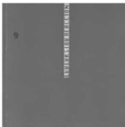
Publicaciones Erreakzioa-Reacción, n.º 6 (1997) y 9 (1999).

3. Los siguiente polos históricos que hemos elegido instaurar en nuestra investigación, Chiapas (1994) y Seattle (1999), constituyen momentos de fuerte eclosión de las nuevas formas de oposición en el interior del proceso de globalización, que desestabilizan el imaginario y el poder neoliberal fuertemente instalados en los años previos de la revolución capitalista. Las tensiones entre los poderes y contrapoderes del proceso de globalización, la crisis del modelo dominante de institución democrática, el fracaso manifiesto de las políticas artísticas y culturales construidas sobre la alianza administración/mercado, son algunos de los rasgos que definen el contexto en el que comienzan a operar prácticas artísticas que atienden de muy diversas maneras a los nuevos fenómenos sociales o a la recomposición de las formas de antagonismo. Hemos querido identificar dos modelos, que no cubren ni mucho menos todo el campo: la manera en que las nuevas prácticas colaborativas establecen lazos innovadores entre las prácticas artísticas y movimentistas, por un lado, y por otro las formas de producción biopolítica que están en la base de la irrupción del arte feminista o en las nuevas prácticas feministas y políticas de género.